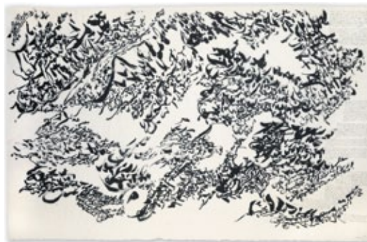
Vers sept heures du matin, pour ainsi dire..., 1978