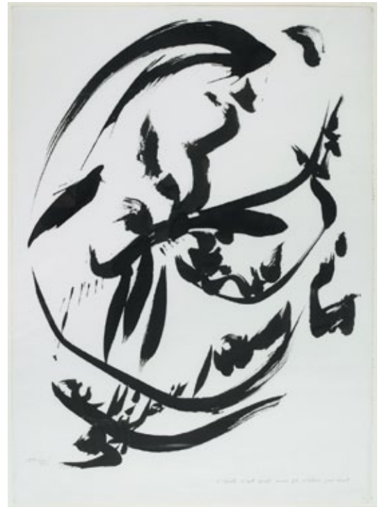
c'écrit c'est écrit mais ça n'était pas écrit , 1975 Encre de Chine et mine graphite sur papier 76,1 x 55,5 cm Signé et daté en bas à gauche : Dotremont / 1975 Paris, Centre Pompidou, Musée national d'art moderne, cabinet d'art graphique - Acquis de la Galerie de France, 1975 Inv. : AM 1975-196