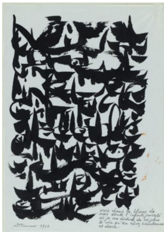
vois dans le blanc de mes écrits l'infecte pureté où je me déchire de ne plus te voir qu'en rêve, cauchemar et désir, 1976

Encre de Chine et mine graphite sur papier pelure