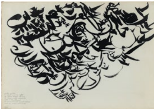
ombre portée... , 1978 Encre de Chine et mine graphite sur papier 63 x 90 cm Signé et daté en bas à gauche : 1978 / Dotremont Paris, Centre Pompidou, Musée national d'art moderne, cabinet d'art graphique Don Pierre et Micky Alechinsky, 2011 Inv. : AM 2011-25