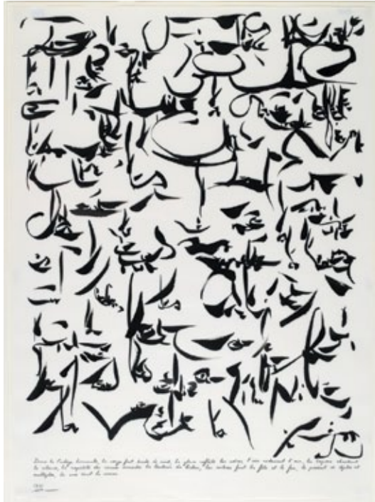
Dans la Finlège hivernale... , 1975 Encre de Chine et mine graphite sur papier 89,5 x 65 cm Signé et daté en bas à gauche : 1975 / Dotremont Paris, Centre Pompidou, Musée national d'art moderne, cabinet d'art graphique - Acquis de la Galerie de France, 1975 Inv. : AM 1975-197