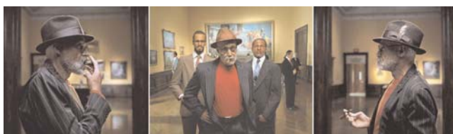
Baltimore Series (Déjà-vu), 2003

triptych of framed digital prints on Epsom Premium Photo Glossy paper, edition # 2/6 images 1&3: 102 x 113.5cm, image 2: 102 x 126.5cm with 5cm spaces © Isaac Julien (IJ 43 2/6)