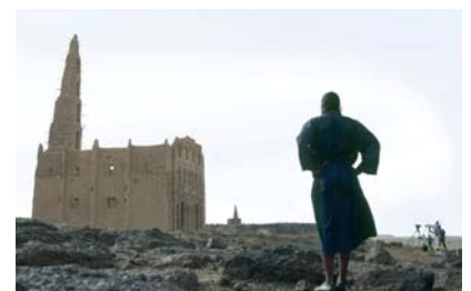
Fantôme créole séries

Lamda print on gloss paper, 19,5 x 119,5 cm © Isaac Julien