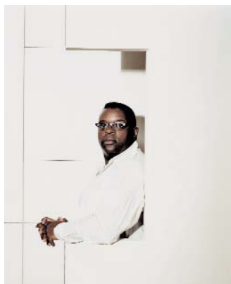
Isaac Julien 2004

ON THIS OCCASION THE ARTIST HAS WAIVED ALL REPRODUCTION FEES FOR THESE IMAGES BUT REQUESTS COPIES OF ALL MATERIALS PRODUCED FOR HIS ARCHIVE AND HIS LONDON AND NEW YORK GALLERIES.