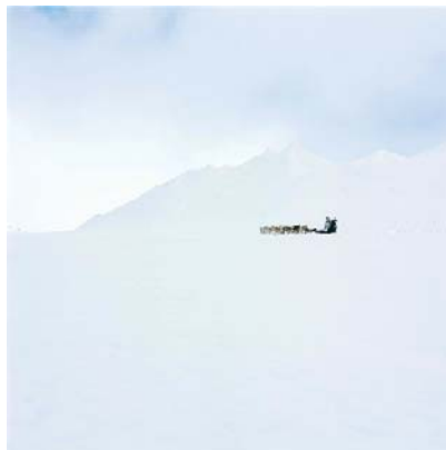
True North Series, 2004

digital print on Epson Premium Photo Glossy, edition # 2/6, 100 x 100cm © Isaac Julien (IJ 62)