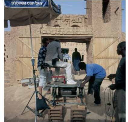
Fantôme Créole Series, 2005 (Mise en scène n°1)

digital print on Epson Premium Photo Glossy, edition of 6, 100 x 100cm © Isaac Julien (IJ 63)