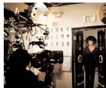
Baltimore Series (Untitled), 2003 framed digital print on Epsom Premium Photo Glossy paper, edition # 2/6, 111 x 138.7cm © Isaac Julien (IJ 57 2/6)

triptych of framed digital prints on Epsom Premium Photo Glossy paper, edition # 2/6 images 1&3: 102 x 113.5cm, image 2: 102 x 126.5cm with 5cm spaces © Isaac Julien (IJ 43 2/6)