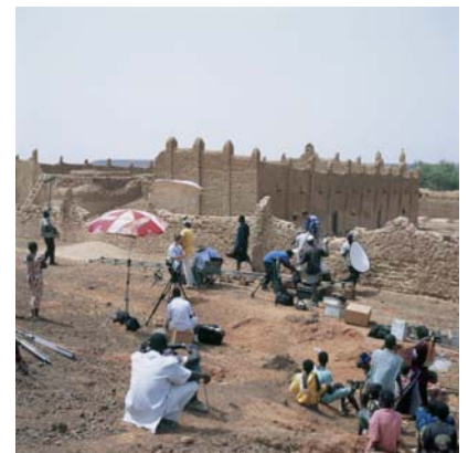
Fantôme Créole Series, 2005 (Mise en scène n°2)

Lamda print on gloss paper, 19,5 x 119,5 cm © Isaac Julien