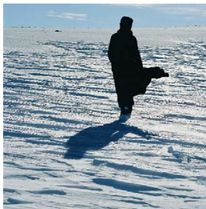
True North Series, 2004

digital print on Epson Premium Photo Glossy edition of 6, artist's proof image: 100 x 100cm each, frame: 114 x 114 cm © Isaac Julien (IJ 61)