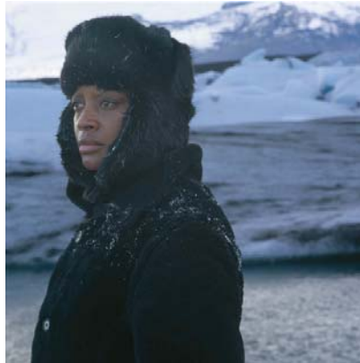
True North Series, 2004

digital print on Epson Premium Photo Glossy edition of 6, artist's proof image: 100 x 100cm each, frame: 114 x 114 cm © Isaac Julien (IJ 61)