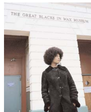
Baltimore Series (Angela in Blue, No.2), 2003 framed digital print on Epsom Premium Photo Glossy, edition # 2/6, 125.5 x 102cm © Isaac Julien (IJ 47 2/6)

Installation audiovisuelle, 3 projections, 3 Bétacam numériques, couleur, son Musée national d'art moderne, Centre Pompidou, Paris AM 2004-78 (Vue de l'installation)