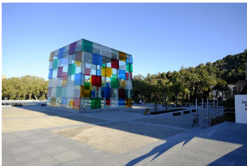
Daniel Buren Incubé travail in situ, Mars 2015, Malaga

La ville de Málaga, a invité l'artiste français Daniel Buren à concevoir une intervention provisoire in situ intitulée Incubé . Habillant les façades de verre du Cubo de carreaux de couleur alternant avec son outil visuel composé de bandes de 8,7 cm, le célèbre artiste intervient ainsi sur le Centre Pompidou Málaga, et lui donne une visibilité singulière marquant le panorama de la cité de sa signature identifiable entre toutes.