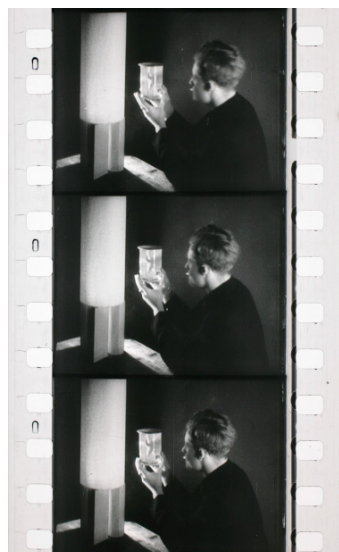
Man Ray [Radnitzky Emmanuel, dit] L'Étoile de mer, 1928, photogrammes