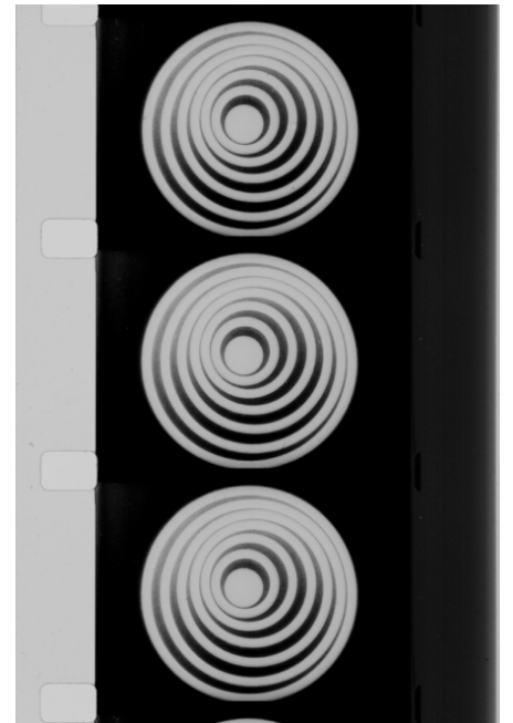
Marcel Duchamp Anémic cinéma, 1925, photogramme – disques optiques Centre Pompidou/Dist. RMN-GP © Succession Marcel Duchamp/ Adagp, Paris