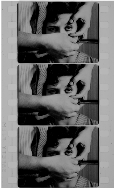
Luis Buñuel Un chien andalou, 1929, photogrammes