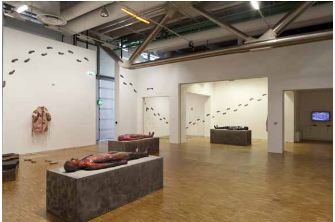
Polyphonies vue de l'exposition @ Hervé Véronèse Centre Pompidou, 2016