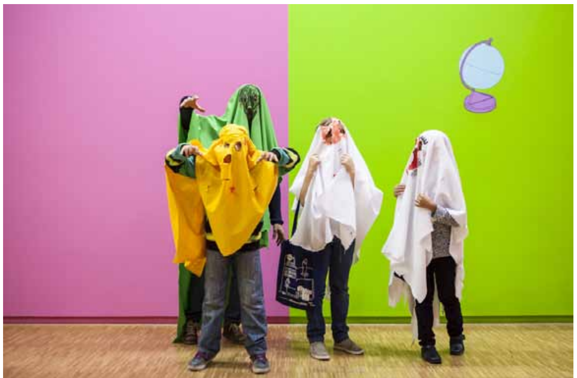
L'Atelier des fantômes, un projet d'Åbäke au Centre Pompidou, 2013

Les projets d'Åbäke sont transdisciplinaires, collectifs et souvent participatifs : il n'est pas rare qu'on y danse, mange et même cuisine ! Co-fondateurs du label de musique Kitsuné en 2002, les membres d'Åbäke ont également leur propre magazine d'architecture, Sexymachinery, et leur propre maison d'édition : Dent-de-Léone.