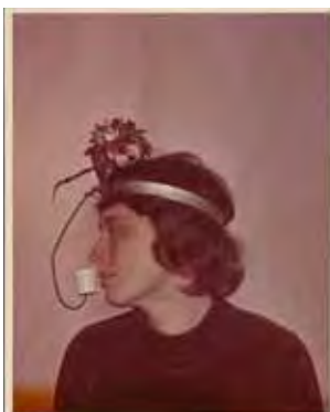
Vitaly Komar, Alexander Melamid Catalogue de super-objets : super-confort pour super-personnes, 1976-1977 Epreuves photographiques Don de la Galerie Ronald Feldman