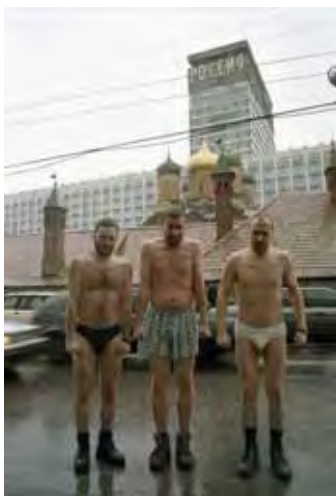
Blue Noses Nouveaux innocents, 1999 C-print Don des artistes