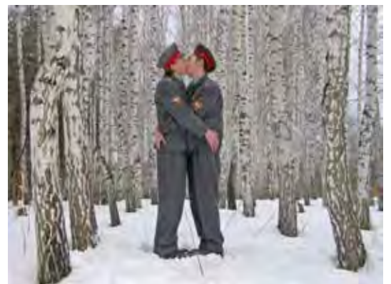
Blue Noses L'ère de la pitié, 2005 C-print Don des artistes