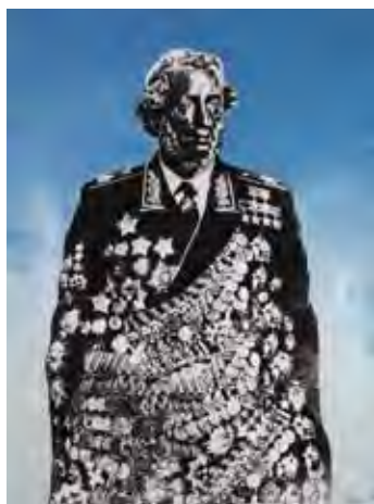
Boris Orlov Portrait de Pouchkine, 1982 Photomontage, 59x44 cm Don de Wladimir et Larissa Fudim