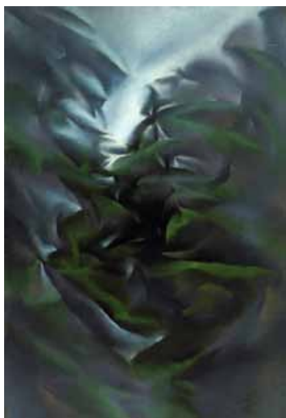
Erik Boulatov Paysage, 1961 Huile sur toile, 79x54 Don de la Tsukanov Family Foundation