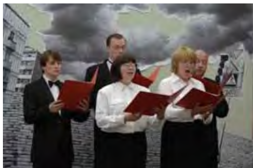
Collectif Chto Delat Perestroïka Songspiel. Victoire sur le putsch, 2008 Vidéo, coul., son, 26'15'' Don des artistes