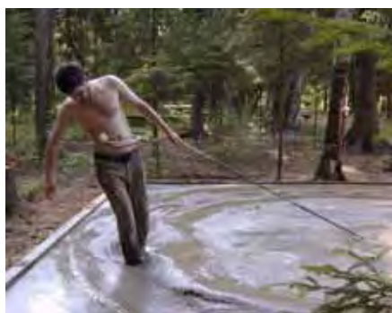
Andrei Kuzkin En cercle, 2008 Vidéo, coul., son Don de l'artiste