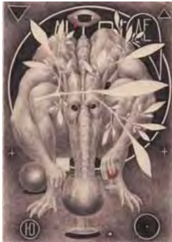
Dmitri Prigov Portrait d'Albert, série «Bestiaire», 1996 Papier, crayon, stylo, stylo bille, acrylique, 29,5 x 21 cm Don de Nadejda Bourova et Andreï Prigov