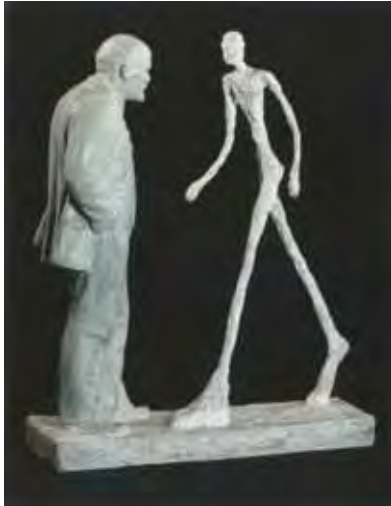
Leonid Sokov Rencontre de deux sculptures, 1989 Plâtre, 49x38x14 cm Don de Ruwim Besser