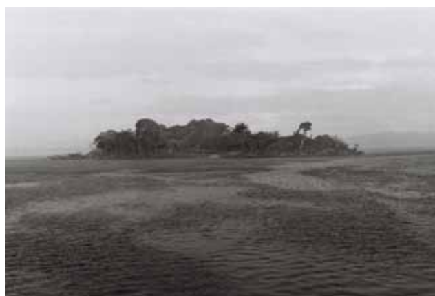
Anarcheology , 2014 Vidéo numérique HD, noir et blanc, silencieux, 12 min 40 s Collection de l'artiste

L'œuvre de Christoph Keller (né en 1967 à Fribourg en Suisse, vivant et travaillant à Berlin) explore les relations entre modernité et redéfinition de la perception. S'inspirant ici de l'anarchéologie foucauldienne, il met en suspens le récit historique dans un espace-temps flottant, tourné vers le modèle de l'Histoire orale des Yanomami d'Amazonie.