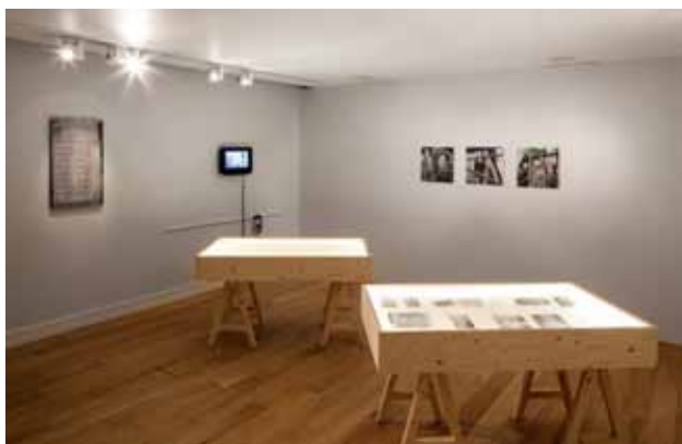
Enclosed , 2013 Installation Vue de l'installation à Mosaic Rooms. Courtoisie de l'artiste et de Mosaic Rooms. Photo : Andy Stagg.

Amina Menia (née en 1976 à Alger en Algérie, où elle vit et travaille) aborde la question du tabou de l'Histoire coloniale face à l'héritage artistique. Dans une installation discursive mêlant archives, travail documentaire et réappropriation, l'artiste développe une enquête sur l'invisibilité des vestiges d'une mémoire conflictuelle.