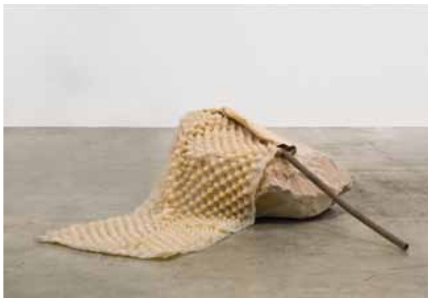
Resting Flag , 2011 Tuyau usé, silicone, pigment, pierre rose, dimensions variables Collection Mona Khashoggi

L'œuvre de Jumana Manna (née en 1987 dans le New Jersey aux Etats Unis, vivant à Berlin) s'attache à observer les usages idéologiques de l'idée d'« origine ». À travers des gestes plastiques chargés d'irrévérence, ses sculptures et ses vidéos commentent les constructions autoritaires de l'identité dans la société contemporaine, touchant à la question du genre autant qu'à celle de l'Histoire.