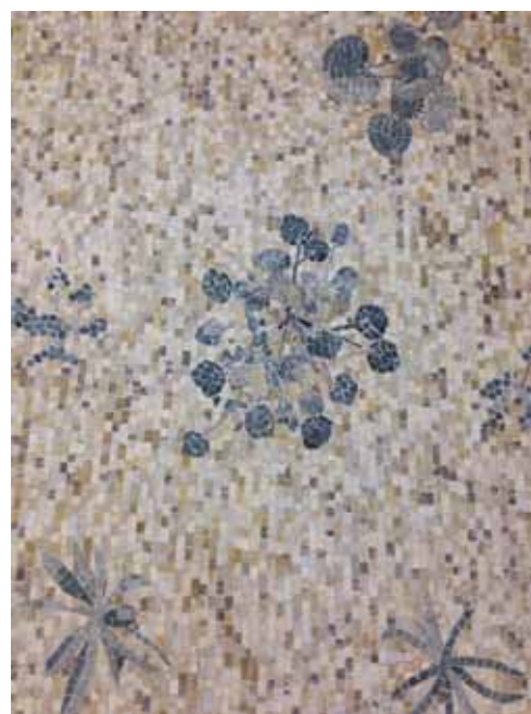
Christodoulos Panayiotou Mauvaises Herbes , 2015 Mosaïque, pierres naturelles, base en bois, 330 x 230 x 6 cm Collection Nouveau Musée National de Monaco