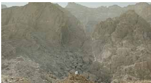
The Digger , 2015 Vidéo numérique HD, 16/9, couleur, sonore, Arabe et Pashto, 24 min Collection Fonds régional d'art contemporain Provence-Alpes-Côte d'Azur

Le travail d' Ali Cherri (né en 1976 à Beyrouth au Liban, où il vit et travaille) porte un regard critique sur la culture muséale héritée du 19 e siècle. Dans ses installations et ses vidéos, l'artiste prend tout particulièrement à parti les procédés d'excavation, de délocalisation et de conservation de restes funéraires qui font violence à des pratiques culturelles intemporelles et au sens même des sites archéologiques.