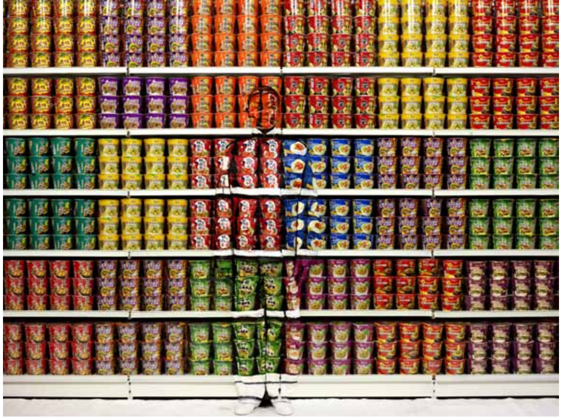
Liu Bolin Hiding in the City, Instant Noodles , 2012 Archival Pigment Print

Des pièces de textiles aux motifs de l'espace sont à disposition des enfants pour qu'ils fabriquent leur costume et disparaissent à leur tour dans l'environnement. Ils doivent composer leur tenue avec les morceaux de tissus et les assembler grâce aux velcros. Enfin, ils choisissent dans l'espace scénographique le lieu où disparaître !