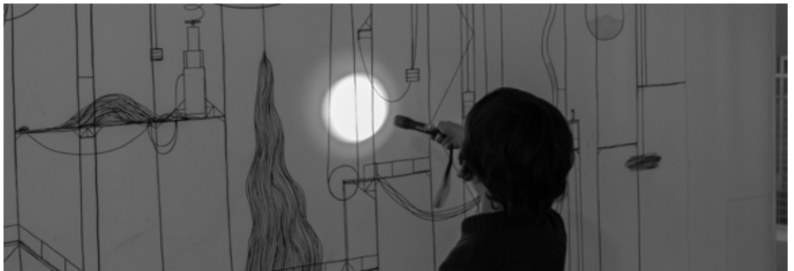
Mon Œil. L'exposition

Le Centre Pompidou propose également des projets éducatifs innovants pour le public scolaire, et invite les élèves à une rencontre avec l'art moderne et contemporain. De la crèche au lycée, le Centre Pompidou accueille environ 140 000 visiteurs scolaires chaque année.