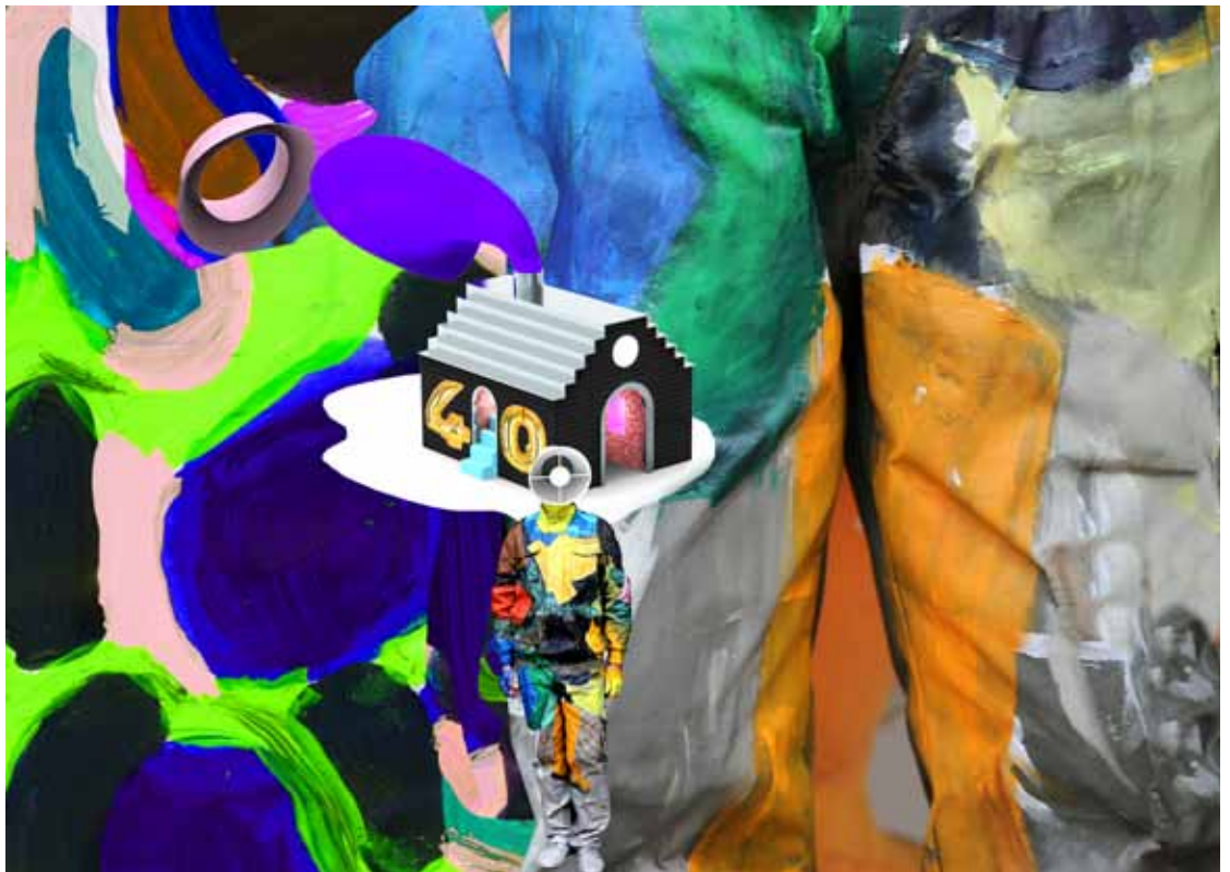
Galerie Party Acte II © Studio GGSV

À l'occasion des 40 ans du Centre Pompidou, le Studio GGSV, composé du duo de designers, Gaëlle Gabillet et Stéphane Villard, a imaginé une manifestation inédite. Ils ont conçu «Galerie Party» comme une fiction, une histoire en trois actes. À chaque épisode, un artiste intervient, modifie l'espace et convie les familles à expérimenter de nouvelles règles du jeu pour explorer, inventer, réapprendre à jouer, à regarder et à créer. Il y est question d'illusions, de magie, de performances, de plaisir... et de fête.