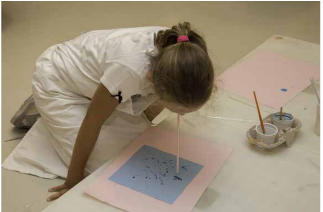
Atelier « Splash! » autour de l'exposition « David Hockney », juin 2017

Pas besoin de regarder sa montre pour participer aux activités du mercredi : les jeunes visiteurs sont accueillis en continu de 14h30 à 17h30 : ils peuvent arriver et partir à l'heure qu'ils souhaitent. Ils participent à la construction d'une installation collective qui envahit peu à peu l'espace. Chaque trimestre le thème est renouvelé.. Pour compléter cette journée créative, le billet Atelier permet de visiter librement le Musée ainsi que l'exposition-atelier de la Galerie des enfants. 2-10 ANS, EN FAMILLE. 14H30 À 17H30 MERCREDIS 27-09 / 4, 11, 18-10 / 8, 15, 22, 29-11 / 6, 13, 20-12 ACCUEIL EN CONTINU