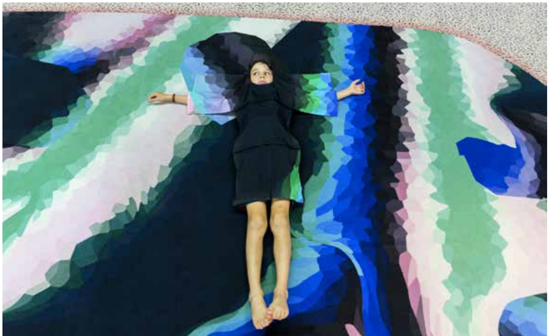
Galerie Party Acte2-@Studio GGSV