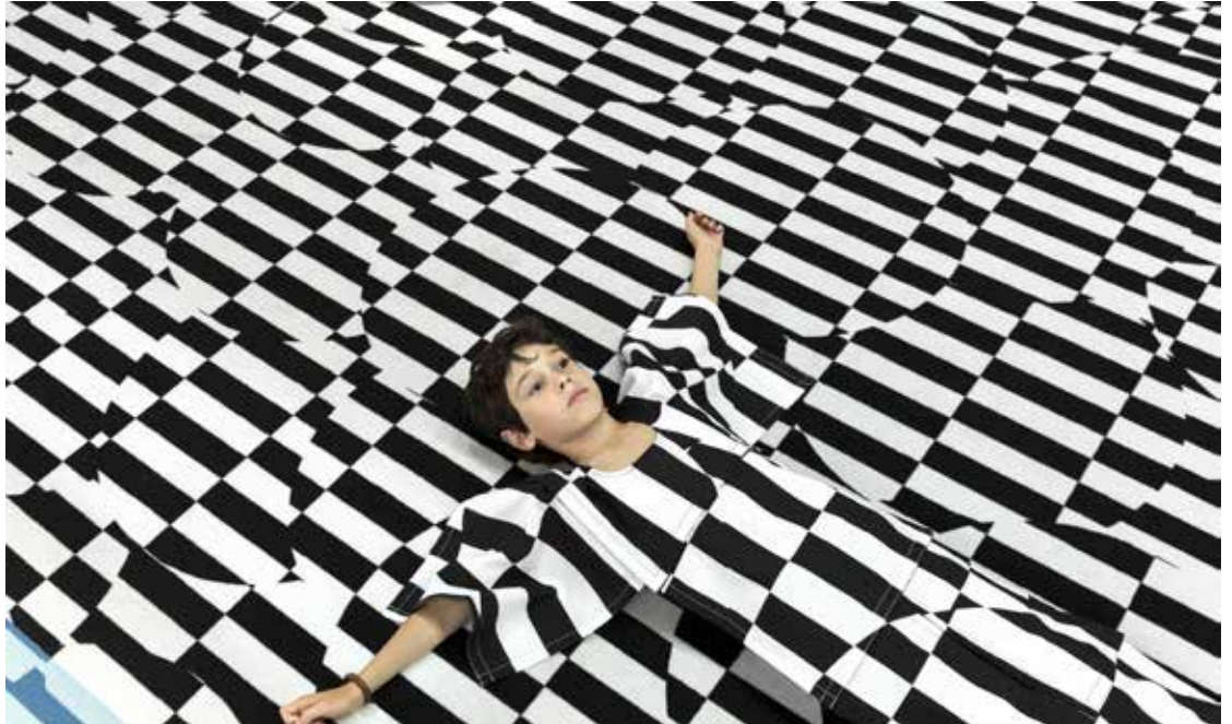
Galerie Party Acte2-@Studio GGSV

Des pièces de textiles aux motifs de l'espace sont à disposition des enfants pour qu'ils fabriquent leur costume et disparaissent à leur tour dans l'environnement. Ils doivent composer leur tenue avec les morceaux de tissus et les assembler grâce aux velcros. Enfin, ils choisissent dans l'espace scénographique le lieu où disparaître !