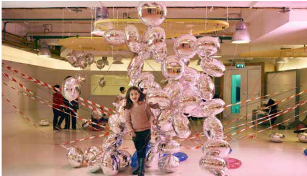
L'Atelier des enfants