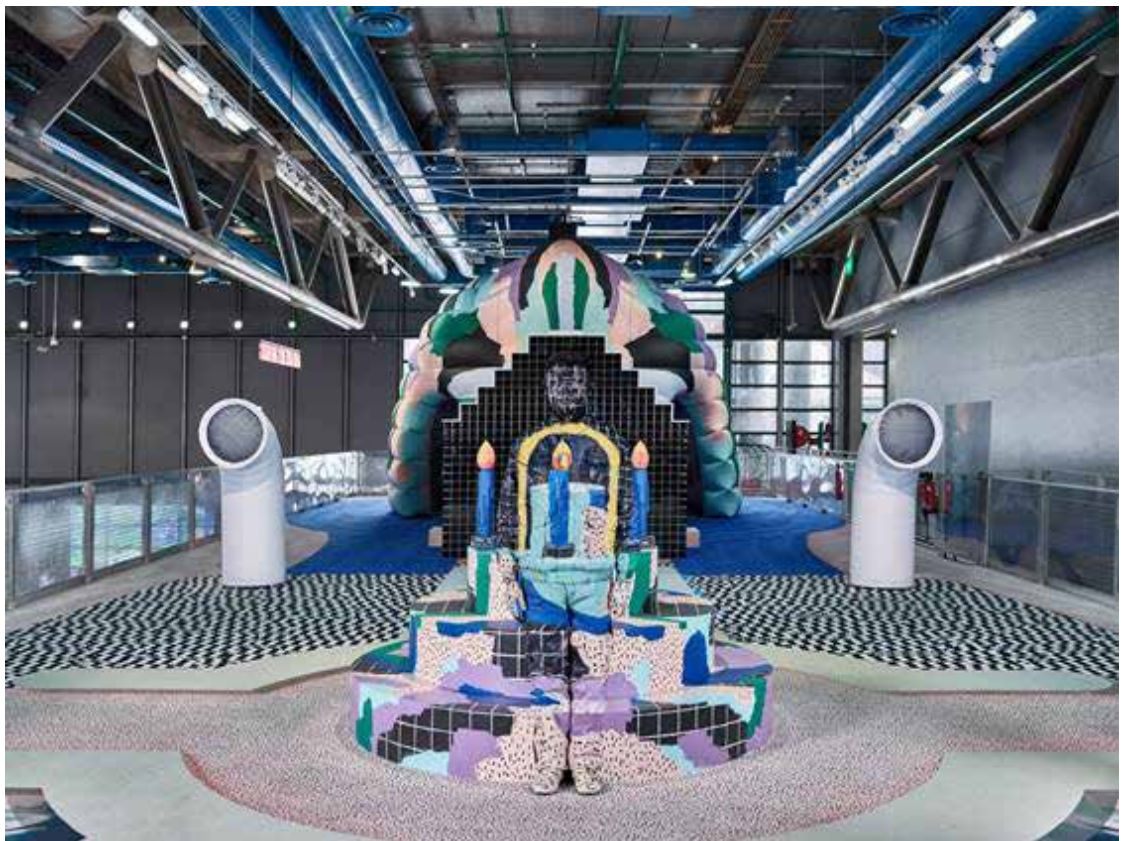
Hide in the City - Paris, Centre Pompidou © Liu Bolin, courtesy of Liu Bolin / Galerie,Paris-Beijing

À l'occasion des 40 ans du Centre Pompidou, le Studio GGSV, composé du duo de designers, Gaëlle Gabillet et Stéphane Villard, a imaginé une manifestation inédite : « Galerie Party ». À chaque épisode, un artiste intervient, modifie l'espace et convie les familles à expérimenter de nouvelles règles du jeu pour explorer, inventer, réapprendre à jouer, à regarder et à créer. Il y est question d'illusions, de magie, de performances, de plaisir... et de fête.