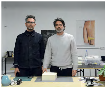
BROOMBERG ET CHANARIN