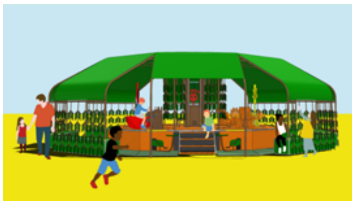
matali crasset Saule et les hooppies tour musical avec Dominique Dalcan projet mobile itinérant © matali crasset