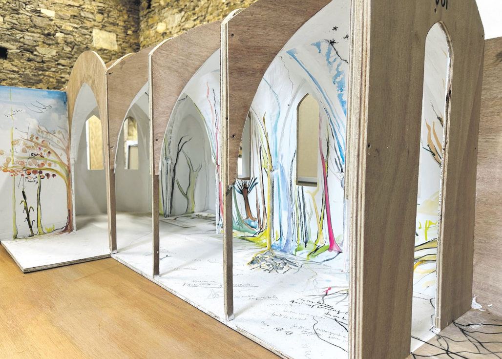
Maquette de la future église de Château-Guibert, photo © Fabrice Hyber, Adagp Paris, 2026