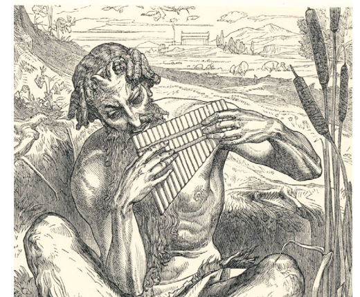
Frederic Leighton, The Great God Pan , 1860

L'auteur Claudius Pan, accompagné par le musicien Ludovic Enderlen, invite à une lecture musicale, inspirée par son roman Les Grands Vivants .