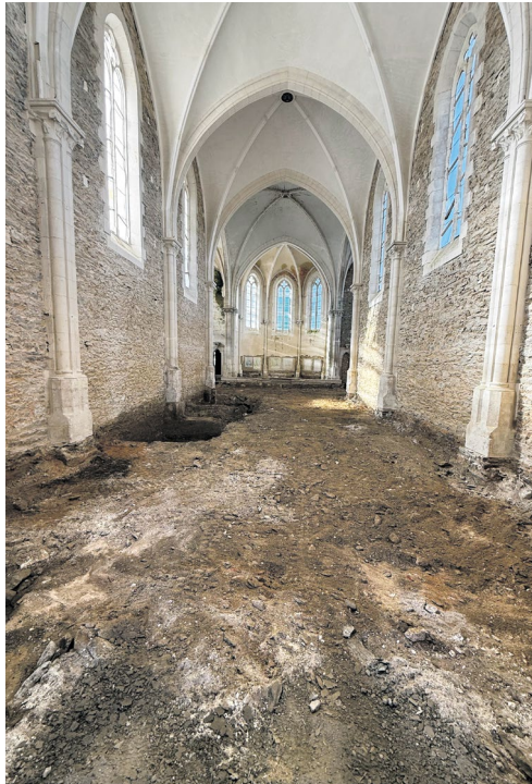
L'église de Château-Guibert, photo © Fabrice Hyber, Adagp Paris, 2026

Au cœur du bourg, l'église devient un lieu spirituel, artistique et sonore pour la Vallée. Fabrice Hyber y imagine une fresque monumentale de 1300 m 2 , dont les dessins et peintures d'arbres se déploient sur les murs et les voûtes. Vitraux et mobilier sont également repensés. Une œuvre sonore créée avec l'Institut de recherche et de coordination acoustique/musique (Ircam) accompagnera le dispositif à partir de 2027. La fresque est initiée par l'artiste durant le festival, au cours de séances publiques en dehors des offices.