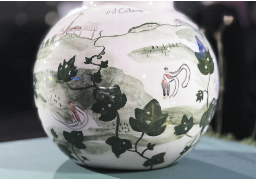
Pauline Rip, La Récolte de la rosée du matin