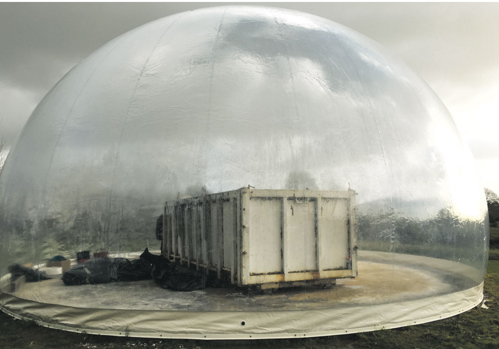
Fabrice Hyber, Le plus grand savon du monde