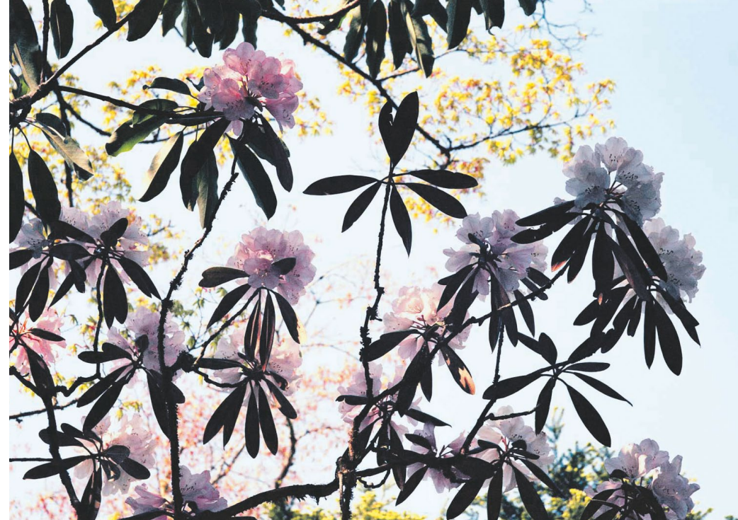
François Fontaine, Eden , photo © François Fontaine