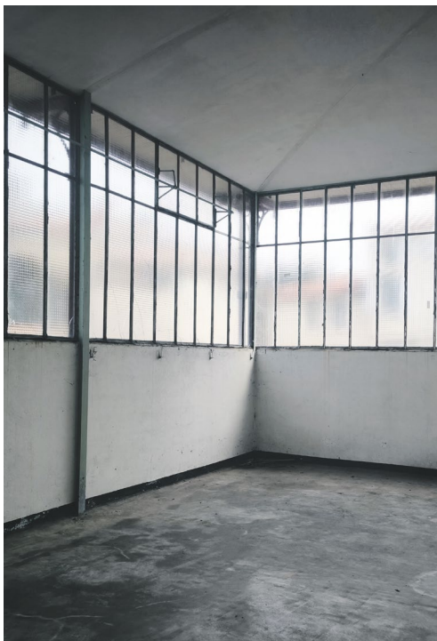
Dominique Blais, Entre les arbres , 2026

La Billerie est un ancien hangar des années 1970. Dès 2028, il accueillera un musée avec une œuvre monumentale de Fabrice Hyber, autour d'une collection unique d'outils et de machines agricoles rassemblée et mise en scène par Philbert Hermouet.