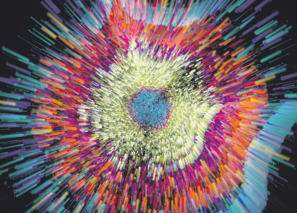
Jane Tingley, Foresta Inclusive , photo © Jane Tingley