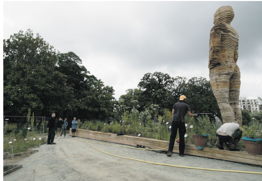
Jack Farman, Espèces Pionnières , photo © Jack Farman