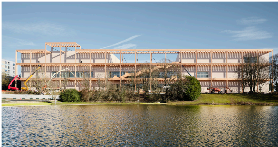
Centre Pompidou Francilien – fabrique de l'art. Mars 2026