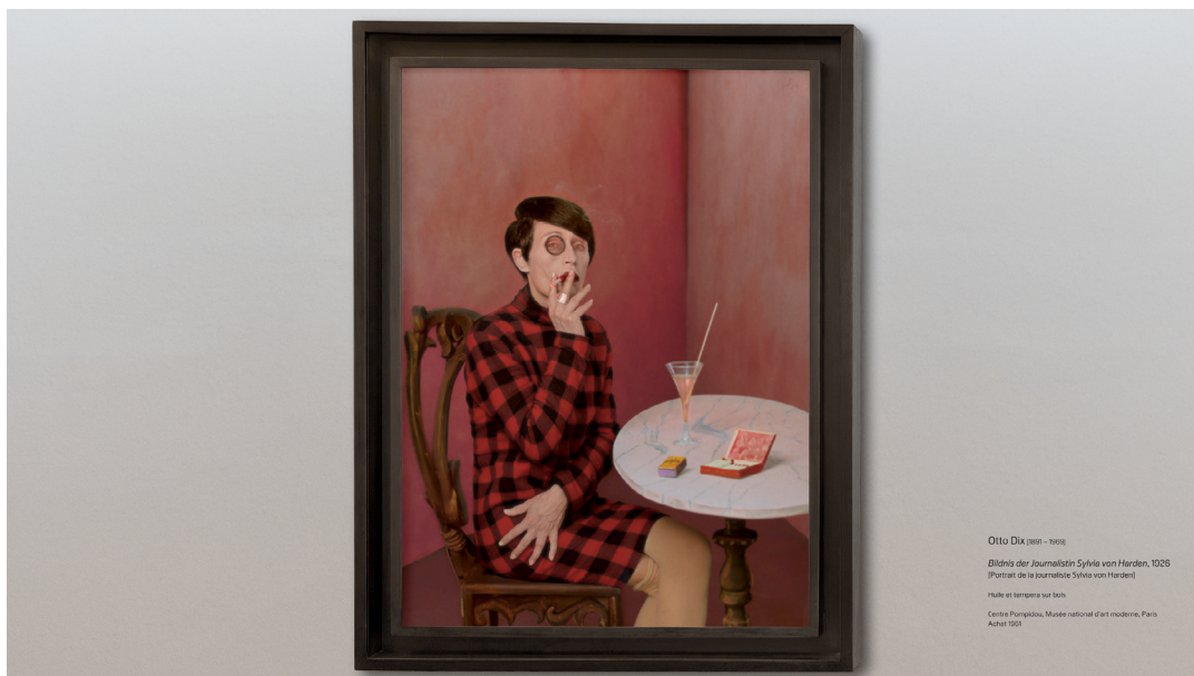
Otto Dix (1891 - 1969) Bildnis der Journalistin Sylvia von Harden, 1926 (Portrait de la journaliste Sylvia von Harden) Huile et tempéra sur bois Centre Pompidou, Musée national d'art moderne, Paris Achat 1961

Capture d'écran de la websérie © Centre Pompidou © Dada Média - Centre Pompidou - 2026