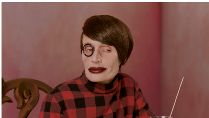
Captures d'écran de la websérie