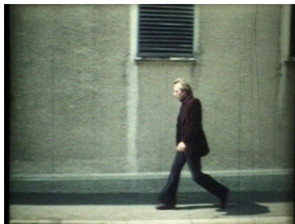
Nesa Paripovic, N.P.1977, 1977 Film Super 8 transféré sur Béta SP, couleur, silencieux. Durée: 20'55 Collection Centre Pompidou, Musée national d'art moderne - Centre de création industrielle © Nesa Paripovic