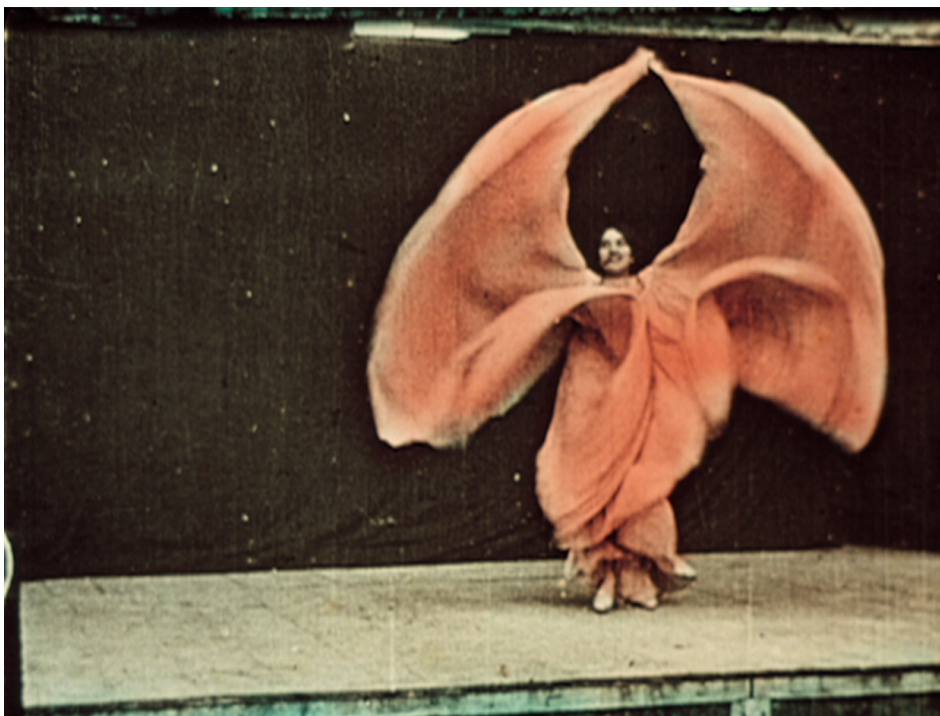
Anonyme (film), Danse serpentine III (Cat. Lumière N°765-1), Collection Centre Pompidou, Musée national d'art moderne - Centre de création industrielle © droits réservés Photo © Centre Pompidou, MNAM-CCI/Service de la documentation photographique du MNAM/Dist. Grand Palais Film

COMMUNIQUÉ DE PRESSE | EXPOSITION INAUGURALE