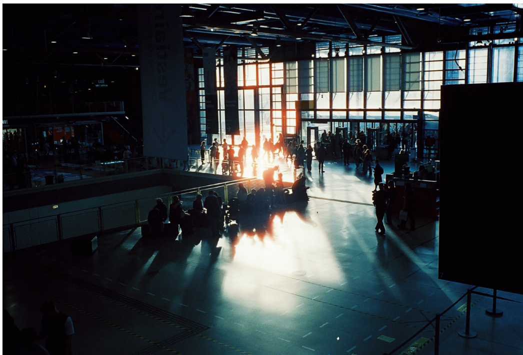
Centre Pompidou © Laurent Delhoume