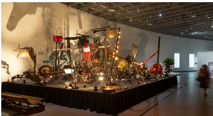
Vue de l'exposition « Niki de Saint Phalle, Jean Tinguely, Pontus Hulten » au Grand Palais avec le Centre Pompidou, du 26 juin 2025 au 4 janvier 2026