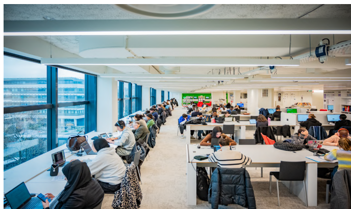
Biblioteca pública de información, edificio Lumière