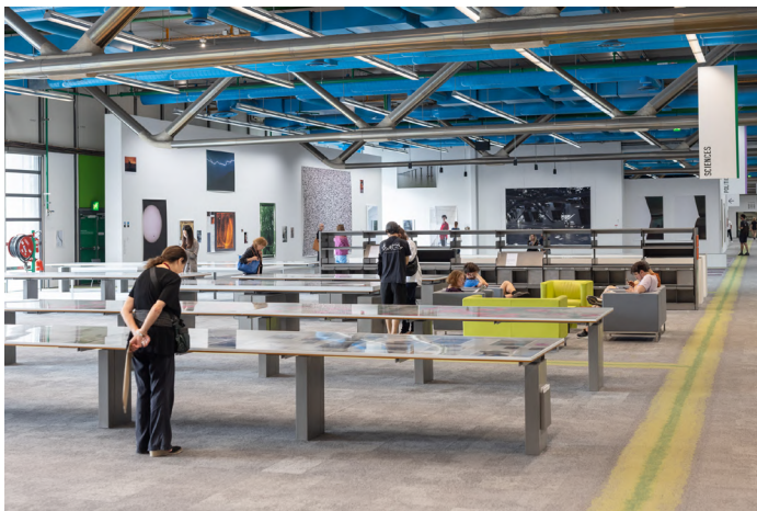
Vista de la exposición « Wolfgang Tillmans. Tout nous y préparait – Rien ne nous y préparait » 13 de junio al 22 de septiembre de 2025