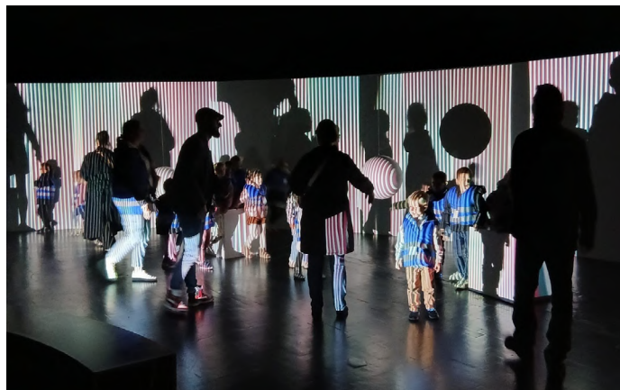
Vista de la exposición «Pom Pom Pidou» en el Tripostal de Lille, del 26 de abril al 9 de noviembre de 2025.

Del 1 de enero al 2 de marzo de 2025, la Bpi ( Biblioteca Pública de Información ) recibió a 225 000 visitantes . Tras varios meses cerrada, reabrió sus puertas el pasado 25 de agosto en el corazón del distrito 12, en el edificio Lumière. Desde entonces, más de 2000 personas la visitan a diario, lo que suma un total de 154 000 visitas .