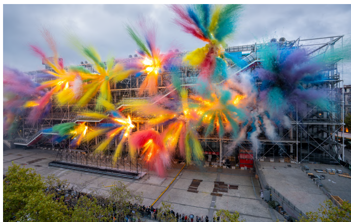
« Le dernier carnaval », Cai Guo-Qiang, 22 de octubre de 2025