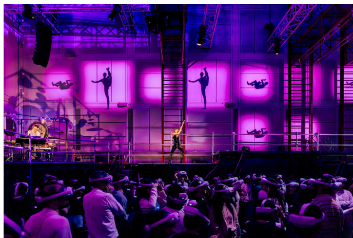
« L'Ombre » de Blanca Li