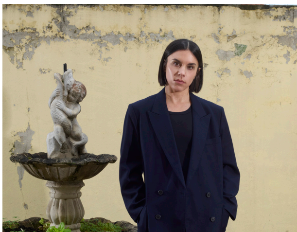
Portrait de C. B. Evans

C. B. Evans est un-e artiste américano-belge vivant et travaillant à Saint-Denis. Leur travail examine la valeur de l'émotion et sa capacité de rébellion lorsqu'iel entre en contact avec des structures idéologiques, physiques et technologiques. En 2024, l'artiste a été invité-e à réaliser un projet spécial par Miu Miu, et en 2025, iel a été chargé-e d'une installation in situ pour la 16e Biennale de Sharjah. C.B. Evans a réalisé des expositions et des commandes pour le Centre Pompidou, la Tate Liverpool, les Serpentine Galleries ou encore la High Line de New York. L'artiste a également participé aux Biennales d'art contemporain de Berlin et de Sydney et leur travail cinématographique a été montré aux festivals de New York et de Rotterdam. Leur travail fait partie des collections permanentes du MoMA et du Whitney Museum (New York), du Centre Pompidou (Paris), et du Musée national d'art moderne et contemporain de Séoul.