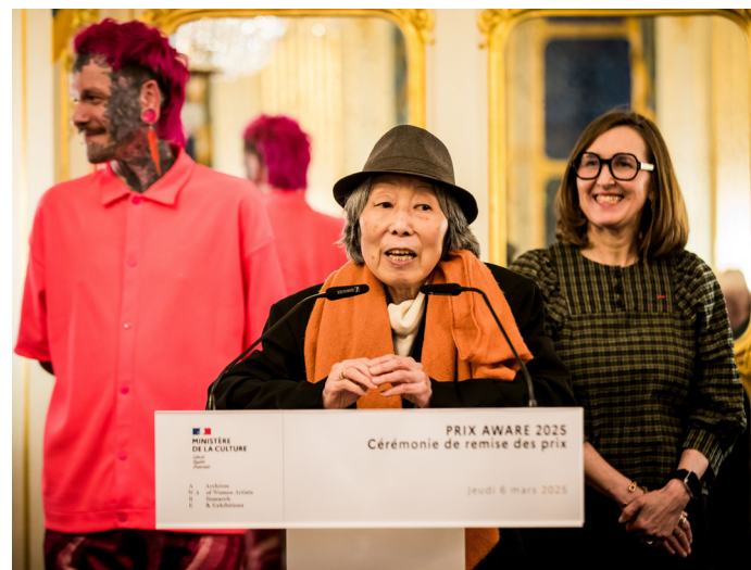
Remise du Prix Aware 2025