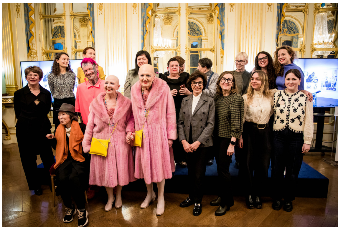
Remise du Prix Aware 2025