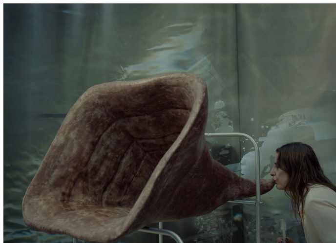
Dead Fingers Talk , Laura Gozlan, 2021 © Tous droits réservés