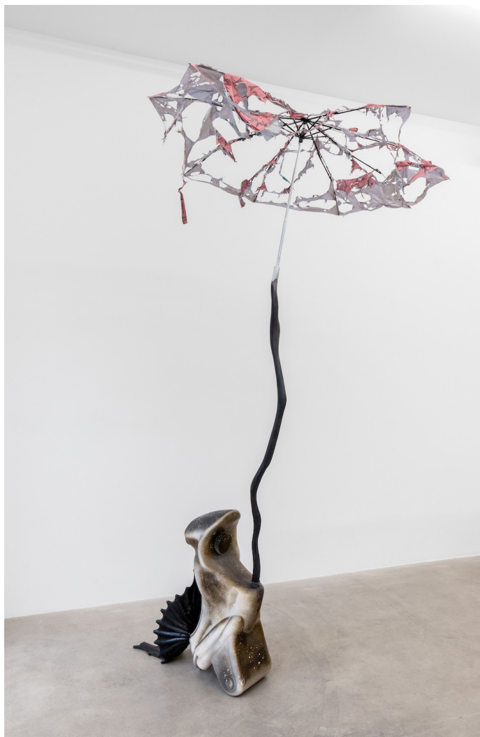
Some like it hot , Laura Gozlan, 2014 © Tous droits réservés