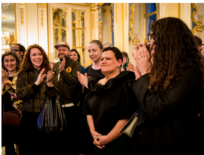
Remise du Prix Aware 2025

À travers la publication d'une collection d'entretiens inédits avec les lauréates du prix d'honneur, réalisés en collaboration avec Manuella Éditions, AWARE contribue aussi à la meilleure connaissance et reconnaissance de leur œuvre. Par exemple, Barbara Chase Riboud, lauréate du prix d'honneur en 2021, a bénéficié de septembre 2024 à janvier 2025 d'une visibilité exceptionnelle grâce au projet Quand un Nœud est Dénoué, Un Dieu est Libéré , une exposition inédite par son ampleur, organisée dans huit musées parisiens, dont le musée du Louvre, le Centre Pompidou et le musée d'Orsay. De même, Laura Lamiel, lauréate du prix d'honneur, en 2022, a été mise en avant au Palais de Tokyo (en 2024) et l'œuvre de Vera Molnár, lauréate du prix d'honneur en 2018, a été célébrée dans une exposition au Centre Pompidou en 2024. Cette reconnaissance se traduit également par la remise d'autres distinctions prestigieuses. Ainsi, Nil Yalter, lauréate du prix d'honneur en 2018, a obtenu en 2024 le Lion d'or à la Biennale de Venise pour l'ensemble de sa carrière, un témoignage éclatant de la portée internationale de son œuvre.