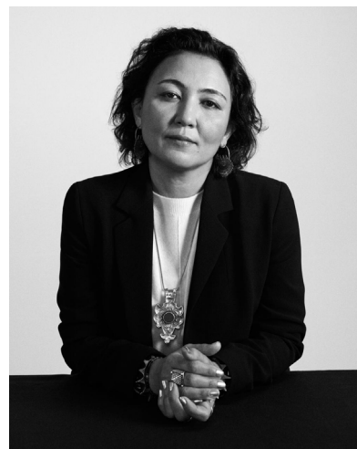
Portrait de Saodat Ismailova

Saodat Ismailova est une artiste et cinéaste installée à Paris dont le travail tisse des souvenirs personnels et collectifs, des mythes et des rituels dans la vie quotidienne, évoquant les histoires multiples de l'Asie centrale. Elle a étudié à l'Institut d'État des arts de Tachkent (Ouzbékistan), à Fabrica (Italie) et au Fresnoy - Studio national des arts contemporains (France). Elle a récemment exposé en solo au Pirelli HangarBicocca, à Milan (2024-2025), au Eye Filmmuseum, à Amsterdam (2023), et au Fresnoy, à Tourcoing (2023). Son travail a été présenté à la Biennale de Venise (2013, 2022), à la documenta fifteen (2022) et dans les principaux festivals de cinéma internationaux. En 2021, elle a fondé DAVRA, un collectif dédié à la connaissance culturelle de l'Asie centrale.