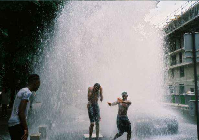
21 — Dans l'eau de Nice, Plaisir , Ismaël Bazri, 2021