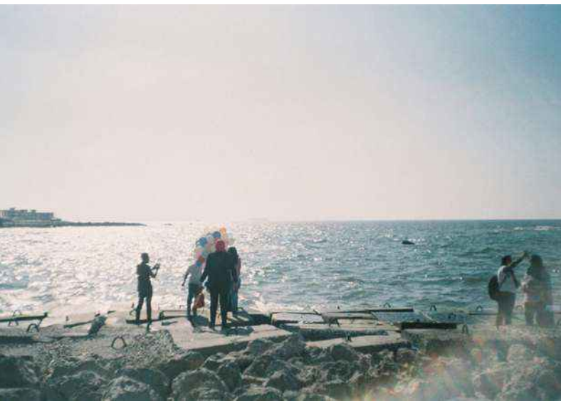
20 — Odyssée , Valentin Noujaïm, 2022 © Valentin Noujaïm