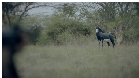
Kiluanji Kia Henda, Havemos de Voltar (We Shall Return) , [Film Still], 2017