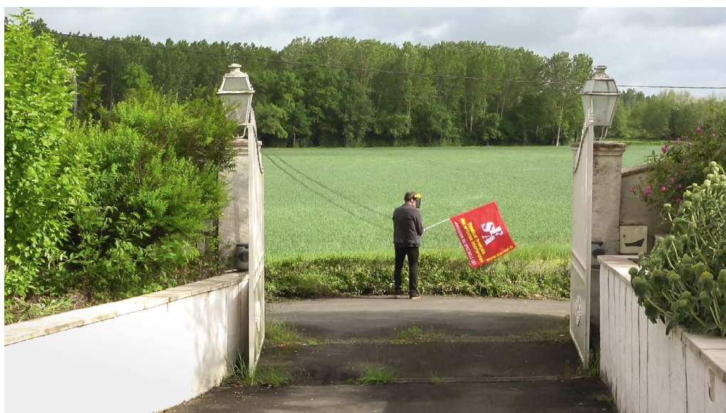
Mais c'est le 1 er mai