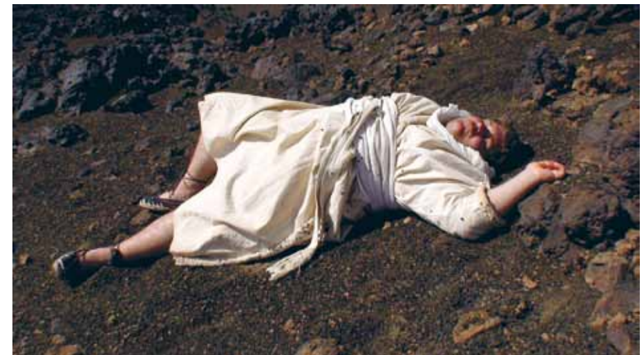
Waiting for Sancho , 2008 © Mark Peranson

Présenté chaque jour, en boucle, au Forum -1, Accès libre