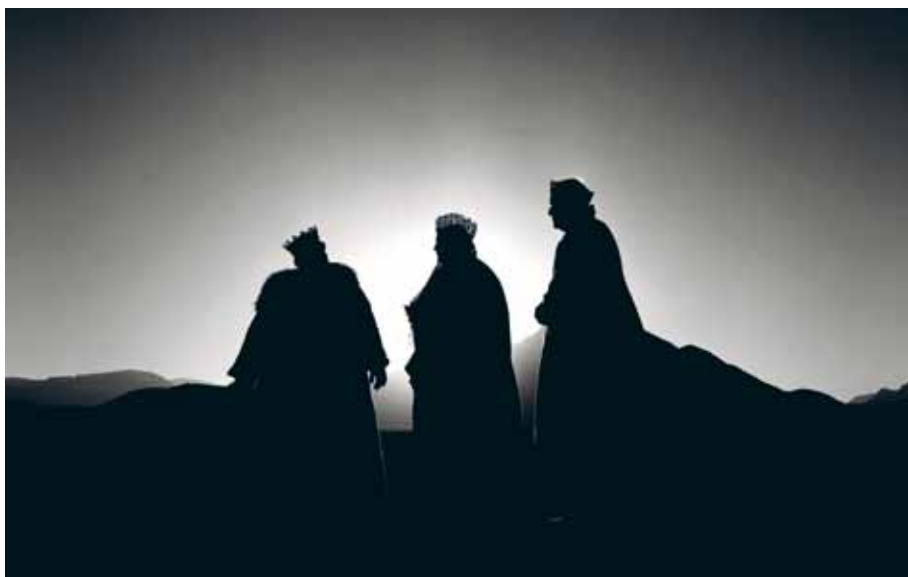
Le Chant des oiseaux, 2008

Jeudi 18 avril, 20h, Cinéma 2, séance présentée par Albert Serra Vendredi 10 mai, 20h, Cinéma 2