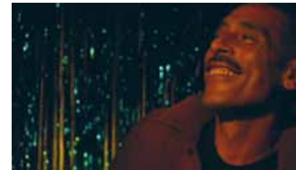
Cuba Llibre, 2013