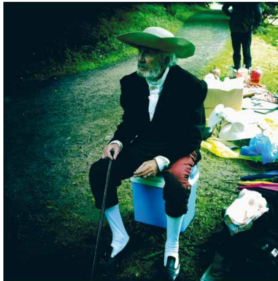
Les Trois Petits Cochons , 2012 © Montse Triola

sa continuité : mis bout à bout, il dure un peu plus de 101 heures. Soit l'équivalent moyen de cinquante longs métrages. Comment atteint-on une telle extrémité de cinéma ? De quelle matière, de quelle vie, remplit-on une telle durée ? Comment, de notre côté, recevoir un tel film ? La seule question qu'il serait inutile de se poser est de savoir si c'est du cinéma ou de l'art contemporain – autant se demander si c'est de l'art ou du cochon,