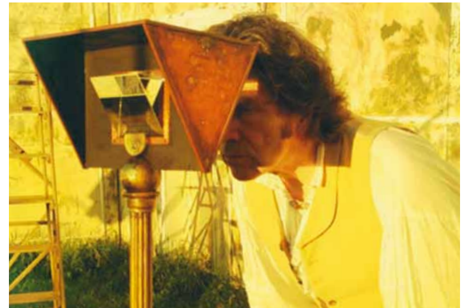
Les Trois Petits Cochons , 2012 © Román Bayarri

Samedi 4 mai, 17h30, Petite salle, entrée libre