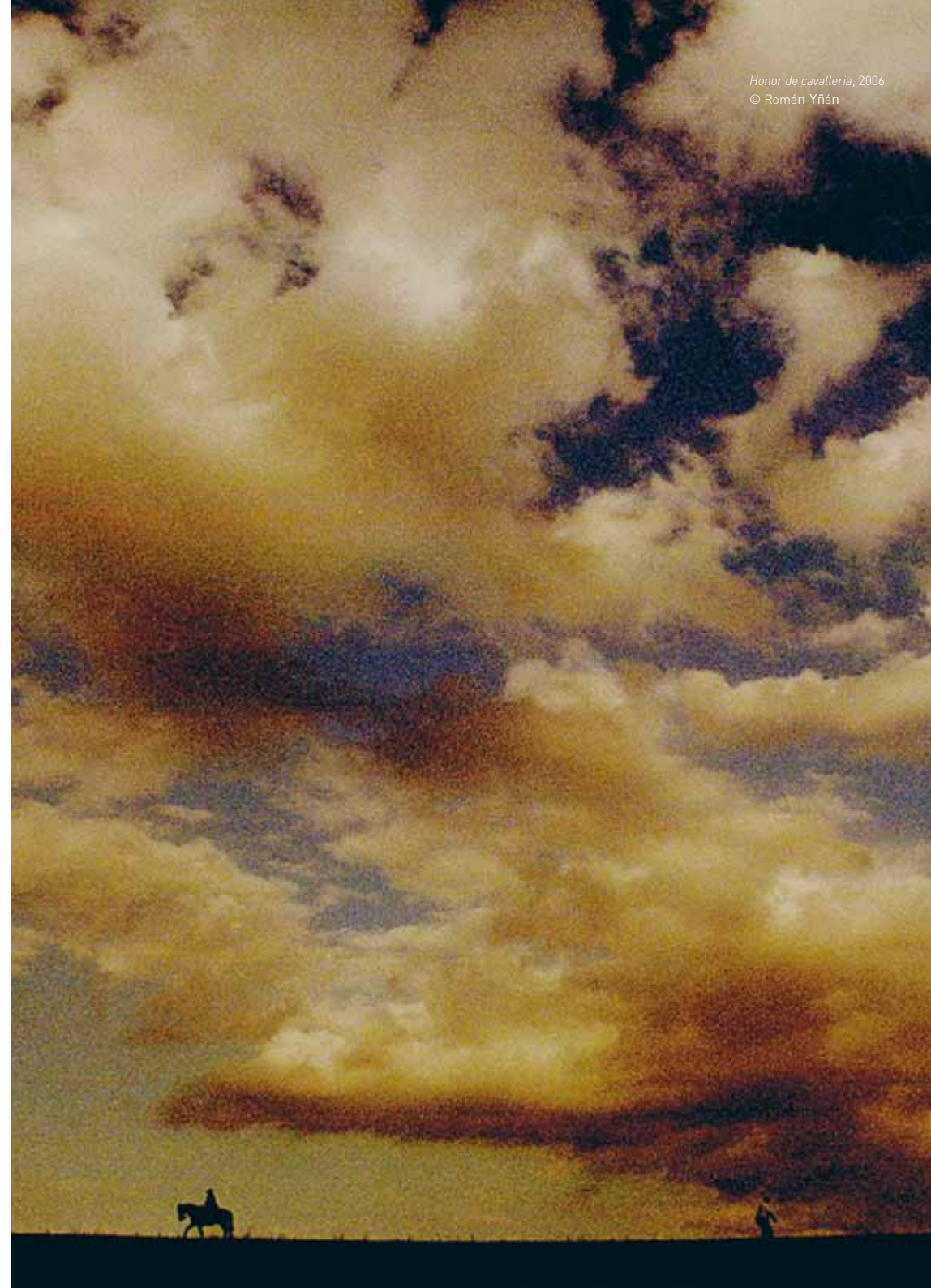
Honor de cavalleria , 2006 © Román Yñán